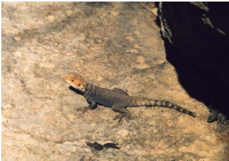
Серый кардинал гор

Он перевел свой взгляд с окна, смутно белевшего в полутемной комнате, на