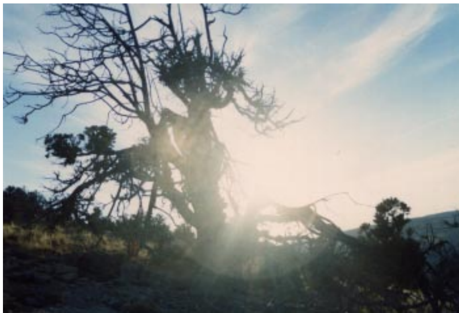
Игры солнца на закате

И вдруг темнота расступилась перед ним, он увидел серую комнату, наполненную людьми в своем огромном безликом доме. Он пытался рассказать людям о том мире, где он побывал. Старался предостеречь их. Но его губы уже не шевелились. Сердце не билось. Он умер.