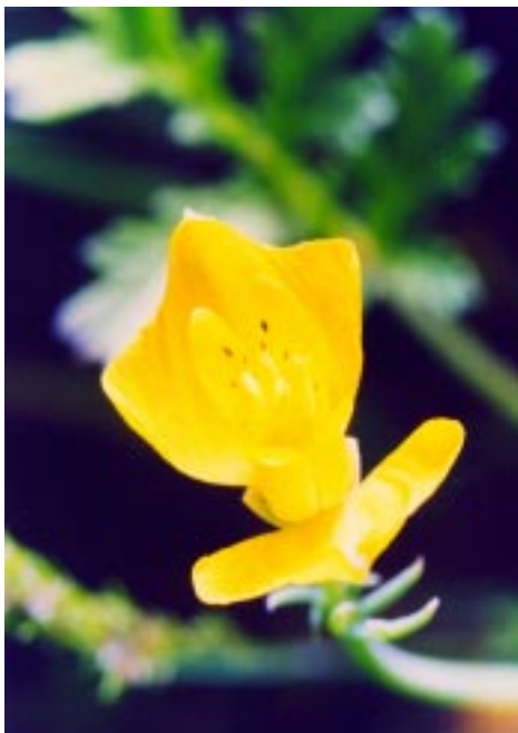
Из цикла «Дети гор»

Однажды, когда мимо проходил Караван, Цветок раскрыл свои глаза И улыбнулся. Вдруг детский голос сказал: “Как красиво!” И еще один сказал: “Как красиво!” “Как красиво! Как красиво! КАК КРАСИВО!!!” Вся пустыня звенела голосами. А цветы улыбались всему миру. Вдруг взрослый голос сказал: